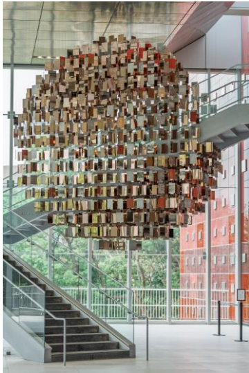
國家檔案館「以史為鏡」公共藝術照

請至檔案局全球資訊網/認識我們/局館簡介/本館簡介/場域介紹，查看相關資訊。( https://www.archives.gov.tw/tw/arctw/699.html )