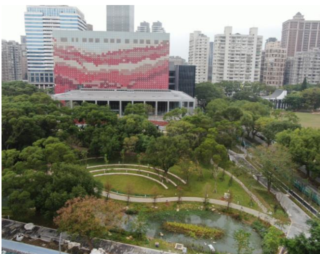
國家檔案館外觀實景圖 1