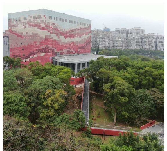
國家檔案館外觀實景圖 2