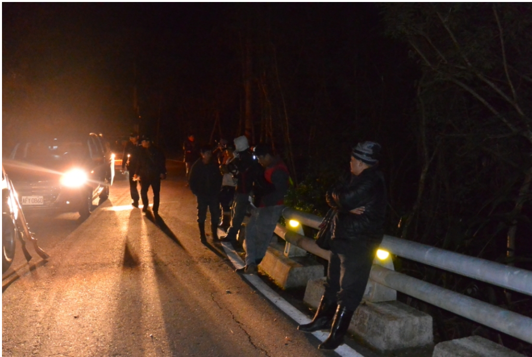
本案員警查察狩獵人員身分及所持槍枝、獵物情形。