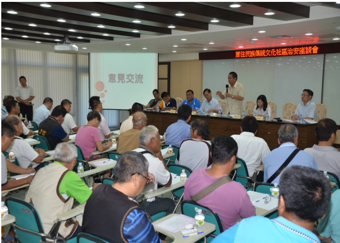
臺東縣警察局舉辦座談會，局長王欽源和與會人員意見交流。